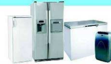
RÉFRIGÉRATEURS / CONGÉLATEURS / CLIMATISSEURS