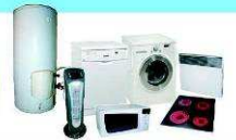
LAVAGE / CUISSON / CHAUFFAGE